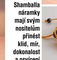
Shamballa náramky mají svým nositelům přinést klid, mír, dokonalost a osvětlení